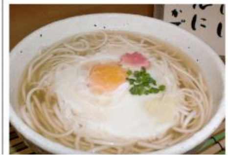
ジャガイモが原料の「豪雪うどん」

催事ビジネスに力 豪雪うどん販売 総営さぼーとは、催事ビジネスに力を入れていきたくて思います。昨年、本州で開かれた北海道物産展に参加させていただく機会があったのですが、その集客力の大きさに改めて驚かされました。今年は倶知安町のご当地グルメ「豪雪うどん」を中心に扱い、全国の皆様を喜ばせたいと計画しております。 昨年の物産展では、道産ジャガイモを使ったコロッケを販売。会場となったデパートには万単位で人が集まり、フロアはぎゅうぎゅう。コロッケは一日あたり2千個以上売れて、大行列の盛況ぶりでした。北海道